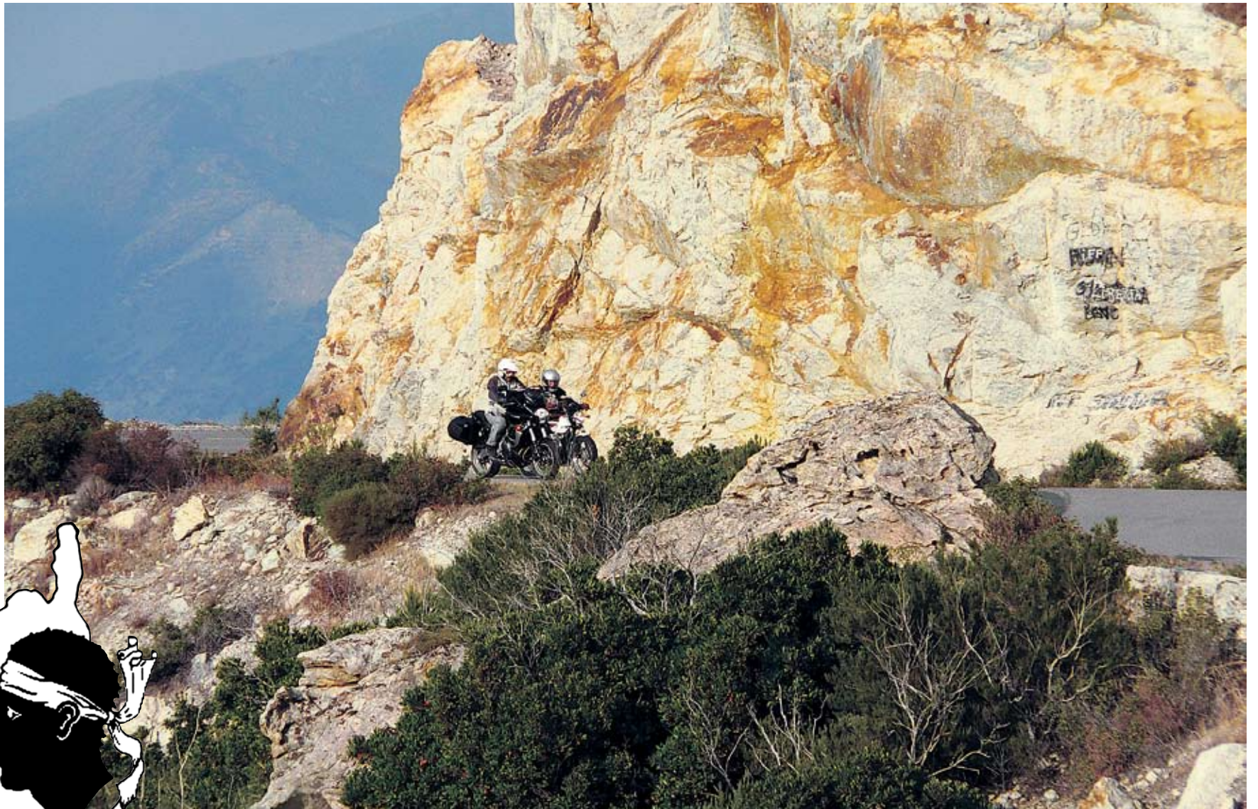
So präsentieren sich die typischen Küstenstrassen, hier in der «Desert des Agriates».

Wir lassen kleine Dörfer und Städtchen hinter uns und machen den ers-